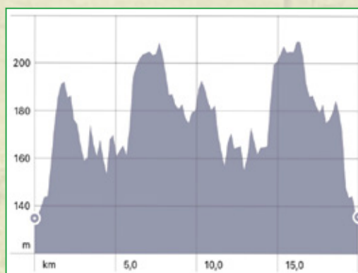
Höhenzunahme 319 m auf der 21 km Strecke