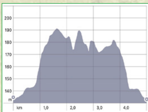
Höhenzunahme 85 m auf der 5,6 km Strecke